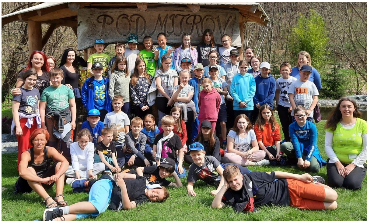
Škola v přírodě 3. + 5. třída