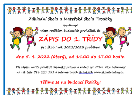
Plakát k zápisu do 1. třídy

(dle §165, odst. 2, písm. c a v přímé souvislosti s §37, zákona č.561/2004 Sb.)