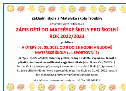
Plakát k zápisu k předškolnímu vzdělávání

Rozhodnutí o nepřijetí k předškolnímu vzdělávání: 9