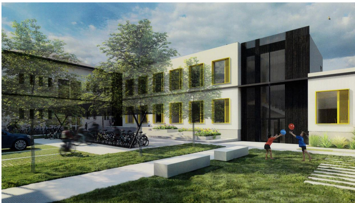
Vizualizace - hlavní budova, nová přístavba v dvorním traktu