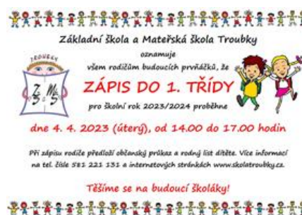
Plakát k zápisu do 1. třídy

(dle §165, odst. 2, písm. c a v přímé souvislosti s §37, zákona č.561/2004 Sb.)