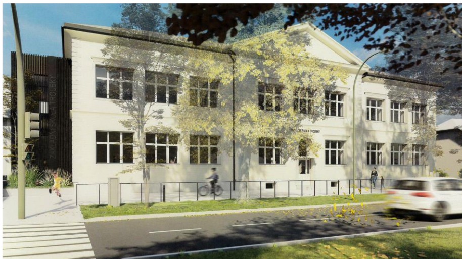
Vizualizace hlavní budova + přístavba v prostoru šaten