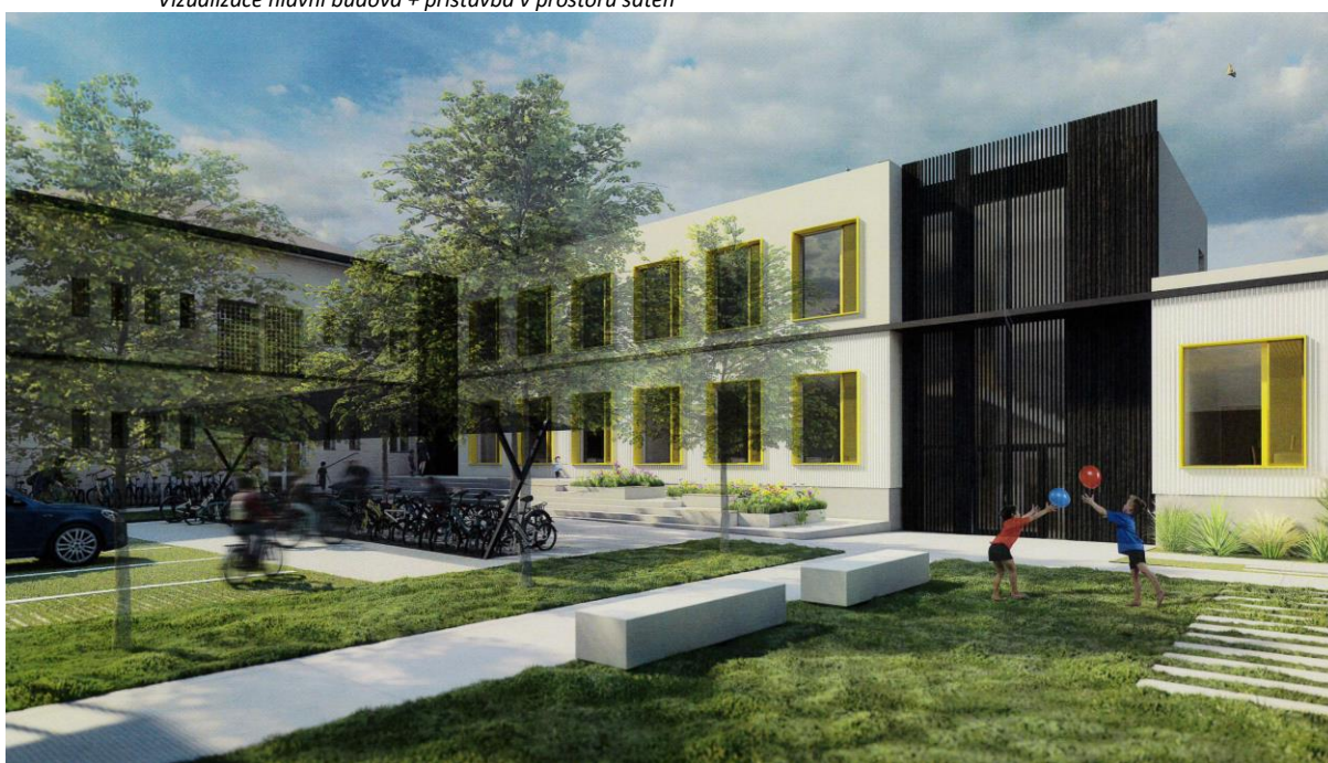
Vizualizace - hlavní budova, nová přístavba v dvorním traktu

V průběhu letošního roku pak obec přistoupila k přípravné fázi nového projektu Novostavba ZŠ Troubky. Zvažovaná novostavba základní školy by měla stát na pozemku Tělovýchovné jednoty Sokol Troubky, mezi ulicemi Sportovní, Na Dolách a ulicí Vlkošská.