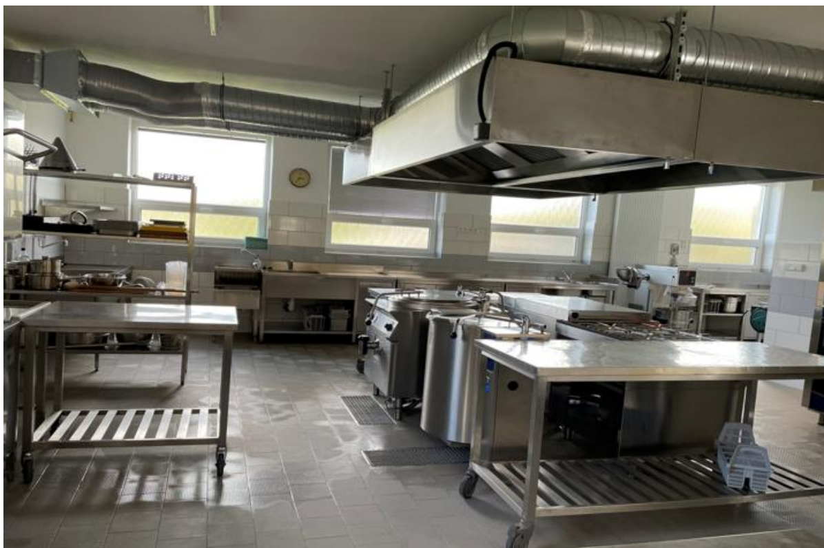
Školní kuchyně po rekonstrukci

Také ve školním roce 2022/2023 byla škola zapojena do projektů „Ovoce a zelenina do škol“ a „Mléko do škol“, díky nimž jsou dvakrát měsíčně obohacovány svačiny žáků prvního i druhého stupně o čerstvé ovoce, zeleninu a mléčné výrobky.